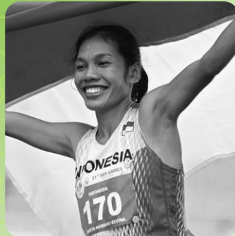
ODEKTA ELVINA NAIBAHO Pelari jarak jauh Indonesia, peraih emas marathon SEA Games 2021. https://www.instagram.com/odekta_naibaho/