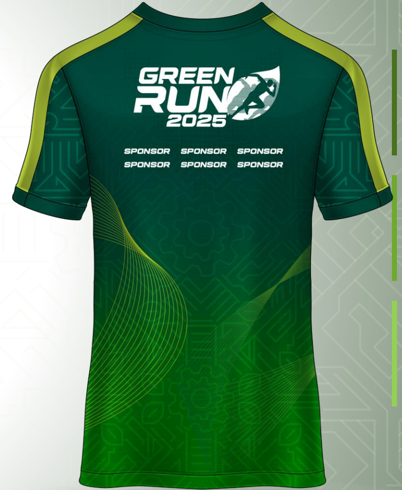
JERSEY – 1 st OPTION