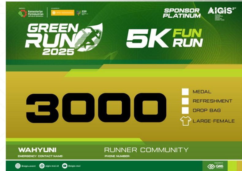
BIB 5K GREENRACE