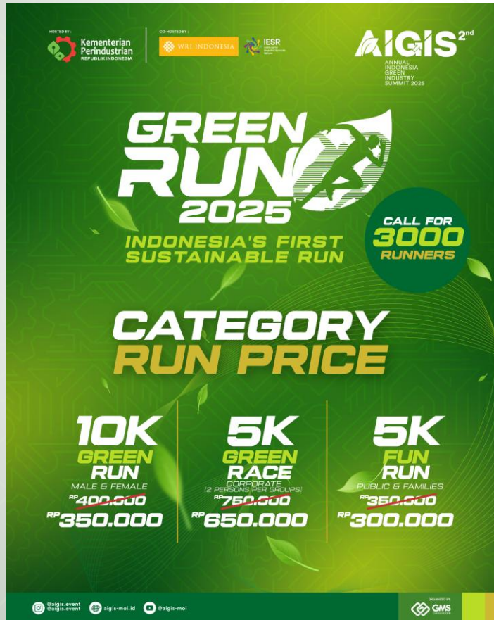
FEED FORMAT CAROUSEL SLIDE 1