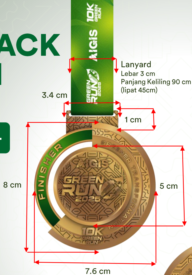
MEDAL 10K GREENRUN BACK