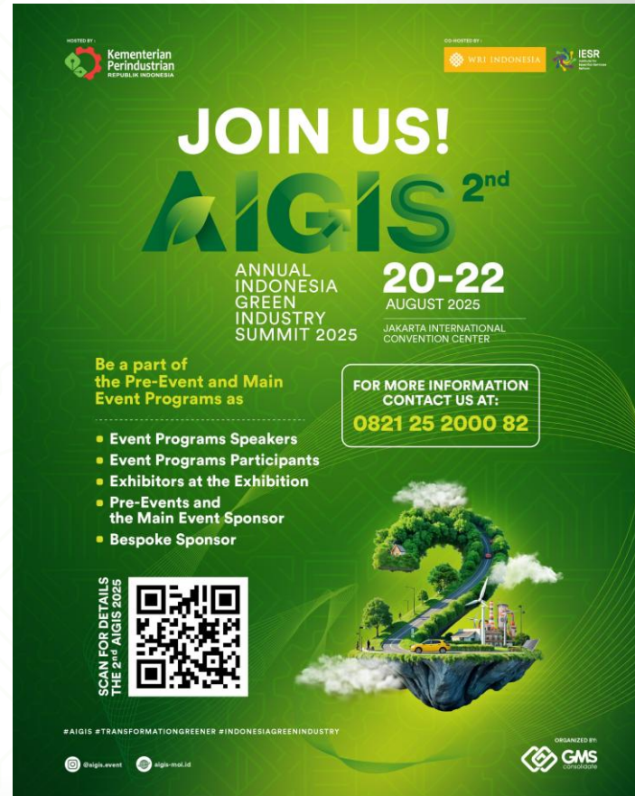
FEED FORMAT CAROUSEL SLIDE 2