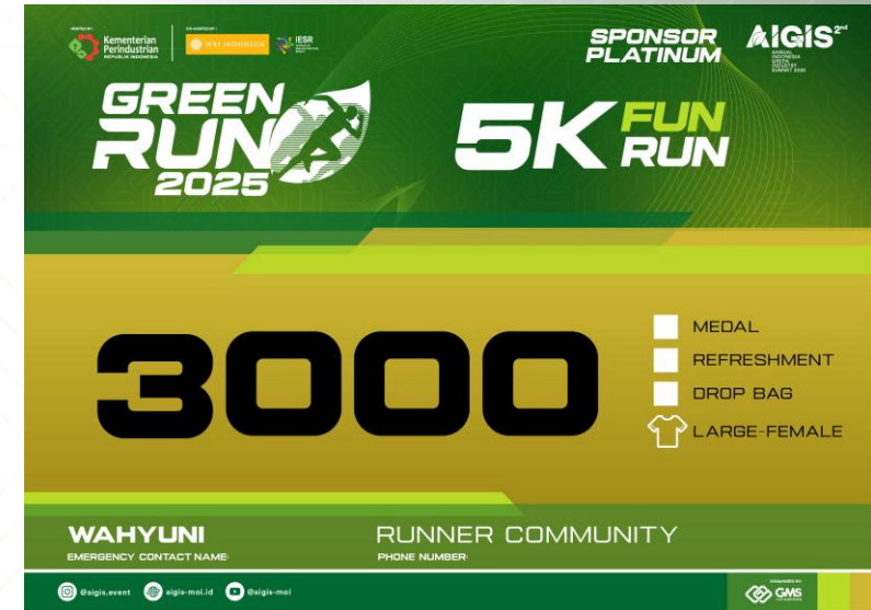
BIB 5K GREENRACE