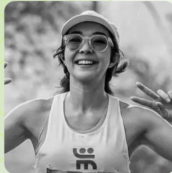
GISELLA ANASTASIA penyanyi dan selebriti Indonesia yang dikenal gemar berlari, sering mengikuti berbagai event lari sambil tetap aktif di dunia hiburan.