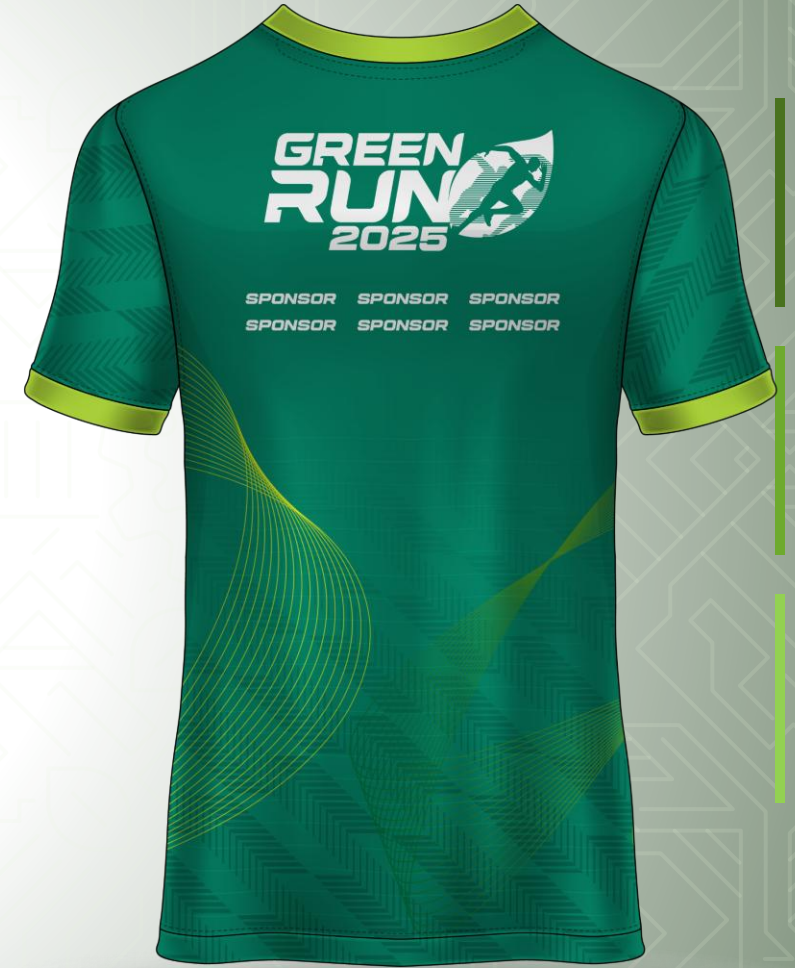
JERSEY – 2 nd OPTION