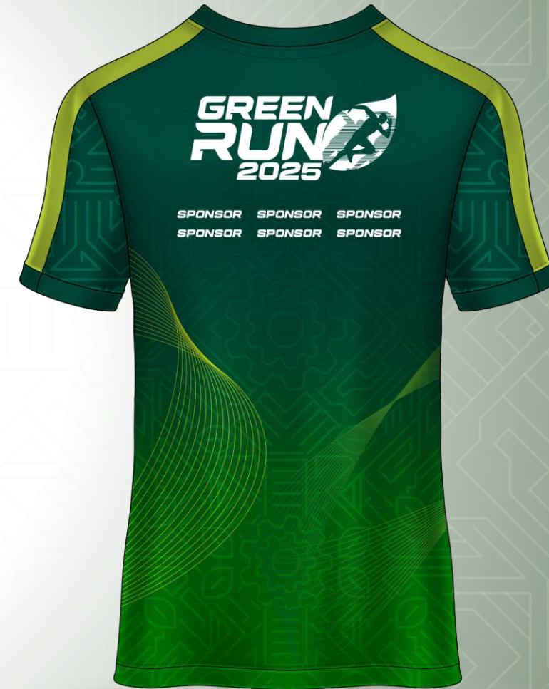
JERSEY – 1 st OPTION