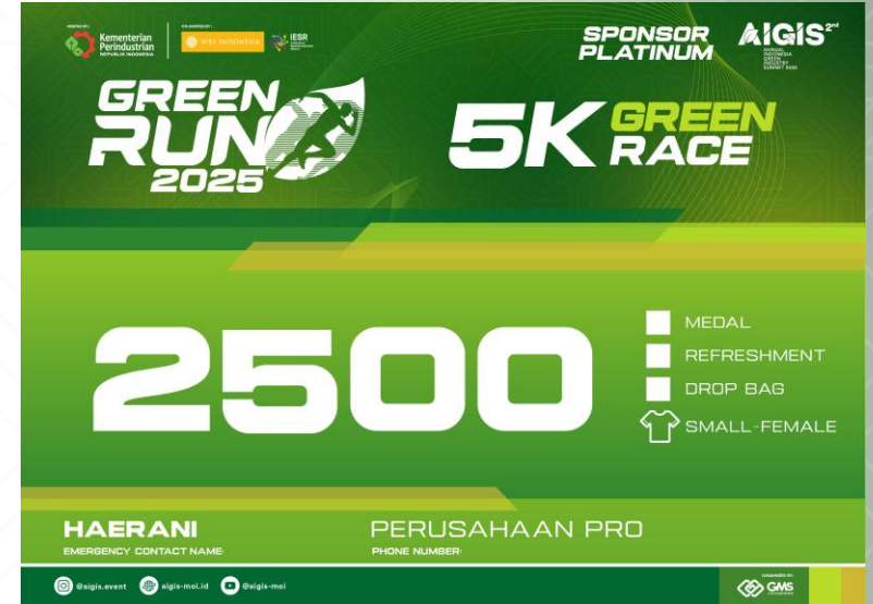
BIB 5K GREENRACE