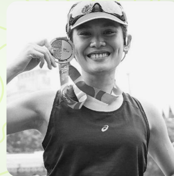
SHERYL SHEINAFIA Musisi dan aktris yang berpartisipasi dalam Sydney Marathon 2024 sebagai bagian dari inisiatif "Move Her Mind". https://www.instagram.com/sherylsheinafia/