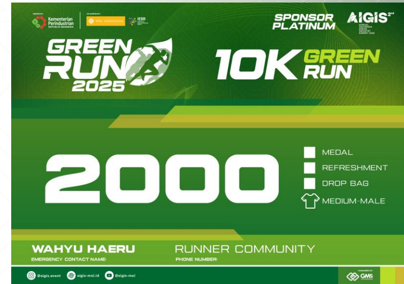
BIB 10K GREENRUN