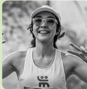
GISELLA ANASTASIA penyanyi dan selebriti Indonesia yang dikenal gemar berlari, sering mengikuti berbagai event lari sambil tetap aktif di dunia hiburan.