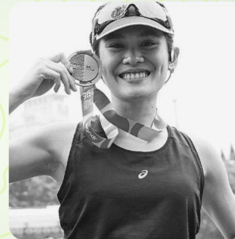
SHERYL SHEINAFIA Musisi dan aktris yang berpartisipasi dalam Sydney Marathon 2024 sebagai bagian dari inisiatif "Move Her Mind". https://www.instagram.com/sherylsheinafia/