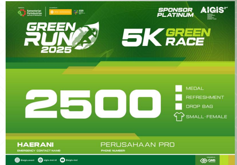
BIB 5K GREENRACE